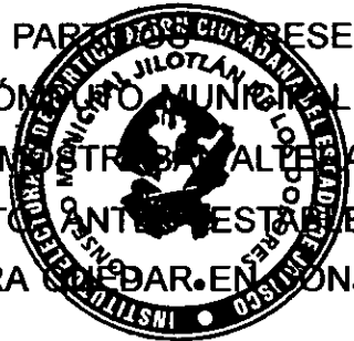
Municipes por Casilla - JILOTLÁN DE LOS DOLORES Digitalizadas : 14 de 14

SE INICIA EXTRAYENDO DE LA BODEGA Y EXAMINANDO LOS PAQUETES ELECTORALES DE CADA UNA DE LAS CASILLAS, SEPARANDO AQUELLOS QUE SE APRECIARON ALTERADOS; PROCEDIENDO EL PRESIDENTE DEL CONSEJO A LA APERTURA EN ORDEN ASCENDENTE DE LAS SECCIONES, SACANDO DEL INTERIOR DE CADA EXPEDIENTE ELECTORAL EL APARTADO DE ESCRUTINIO Y CÓMPUTO DEL ACTA DE LA JORNADA ELECTORAL, ESCRITOS DE PROTESTA, INCIDENTES, ETC. A CONTINUACIÓN SE PROCEDIO A TOMAR NOTA DE CADA UNO DE LOS RESULTADOS QUE SE HICIERON CONSTAR EN LOS APARTADOS EN CITA, Y AL SER COTEJADOS Y VERIFICADOS LOS MISMOS CON EL ACTA QUE OBRA EN PODER DEL CONSEJO, SUS RESULTADOS SERAN CONSIDERADOS VÁLIDOS Y SE COMPUTARAN. A CONTINUACIÓN SE ABRIERON LOS PAQUETES QUE INICIALMENTE FUERON SEPARADOS POR APRECIARSE ERROR, ALTERACIÓN O AUSENCIA DE ACTAS PARA SU COTEJO, PROCEDIENDO EN LOS PAQUETES EN QUE NO SE ENCONTRÓ ACTA LEGIBLE, DIFERENCIA ENTRE LOS RESULTADOS O INEXISTENCIA DE ACTAS, A REALIZAR POR ESTE CONSEJO MUNICIPAL EL ESCRUTINIO Y CÓMPUTO, LEVANTADO EL ACTA CORRESPONDIENTE, ENTREGANDO COPIA A LOS REPRESENTANTES DE LOS PARTIDOS PRESENTES, Y AGREGANDO LOS RESULTADOS OBTENIDOS AL CÓMPUTO MUNICIPAL RESPECTIVO; FINALMENTE SE ABRIERON LOS PAQUETES QUE MOSTRABAN ALTERACIÓN Y UNA VEZ VERIFICADO Y REALIZADO EL PROCEDIMIENTO ANTES MENCIONADO, SUS RESULTADOS SE SUMARON Y COMPUTARON PARA COMPARAR EN CONJUNTO COMO SE MUESTRA EN LA SIGUIENTE TABLA.